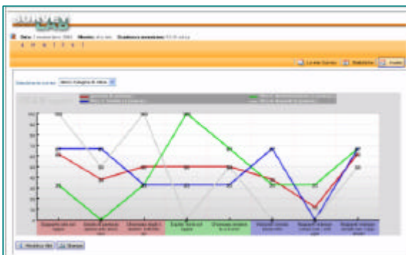
Uno dei grafici a disposizione del gestore per l'analisi dei risultati: punti di forza e di debolezza segmentati in base alle diverse aree funzionali coinvolte.