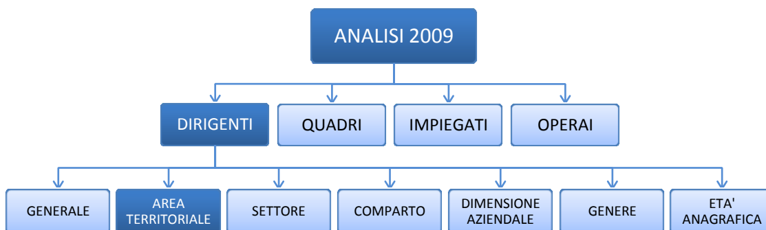
Analisi Generale Dirigenti per area territoriale